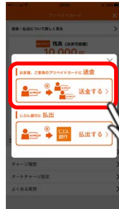
<送金・払出選択画面>