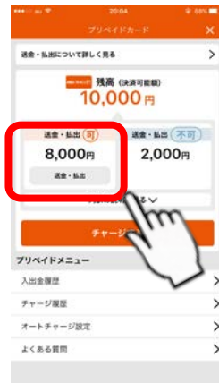
<チャージ・出金画面>