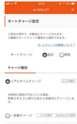
<オートチャージ設定>