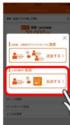
<送金・払出選択画面>