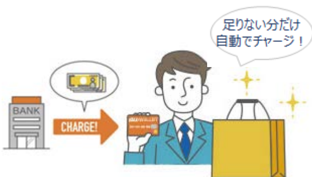
<「リアルタイムチャージ」の利用イメージ>

個人間の「送金」では、「au WALLET プリペイドカード」をお持ちのお客さま同士でチャージ残高の送金が可能になります。「au WALLET アプリ」から相手先の携帯電話番号と氏名カナ（2文字）を入力することで、面倒な現金のやりとり無く、簡単にご家族・ご友人間でお金のやりとりを完結できます。また、じぶん銀行への「払出」では、チャージ残高をじぶん銀行口座へ出金することが可能となります。