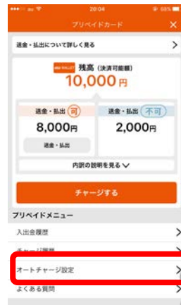
<チャージ・出金画面>