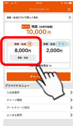
<チャージ・出金画面>